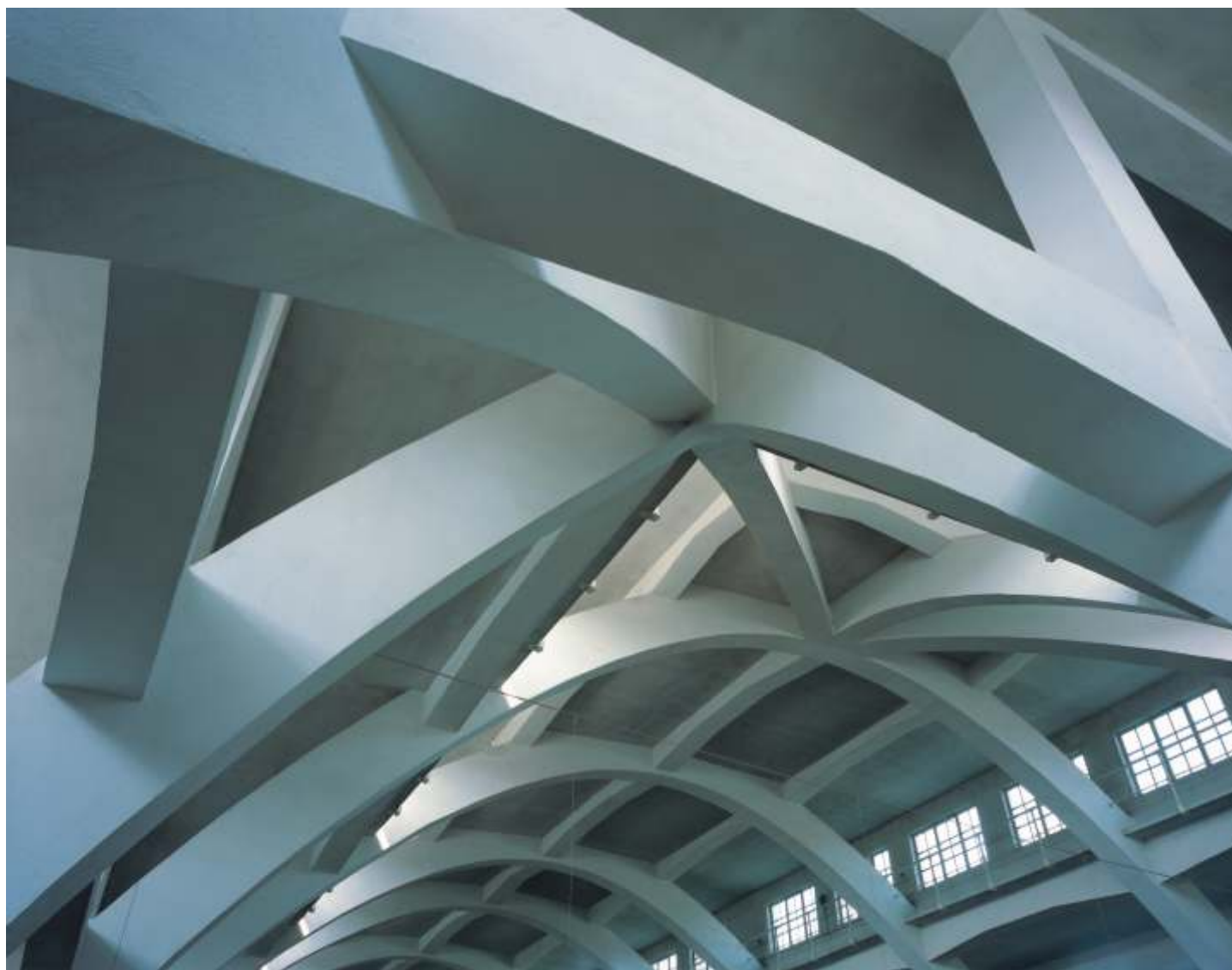
Podolská vodárna